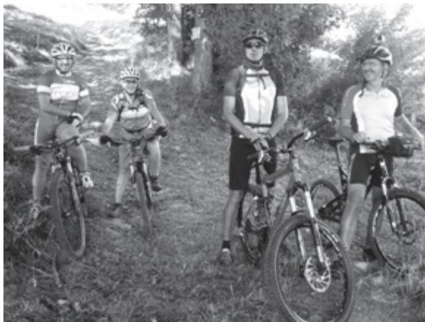
Gute Laune nach einer gelungenen, aber felsigen Abfahrt vom Lac Blanc nach Orbey.

Leider hatte sich auf dem verblockten, felsigen Untergrund der eine oder andere Kettenblattzahn verabschiedet, was aber keine größeren Probleme bedeutete.